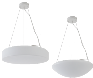
Armatur mit Treiber ohne Abdeckung