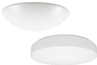
Armatur mit Treiber ohne Abdeckung