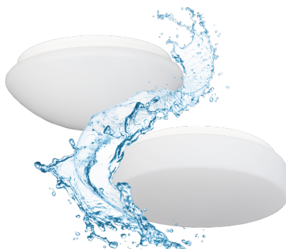
Armatur mit Treiber ohne Abdeckung