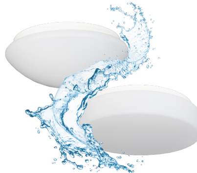
Armatur mit Treiber ohne Abdeckung