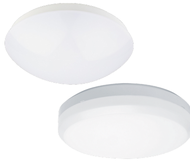
Armatur mit Treiber ohne Abdeckung